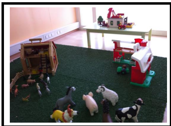
LES ANIMAUX DE LA FERME